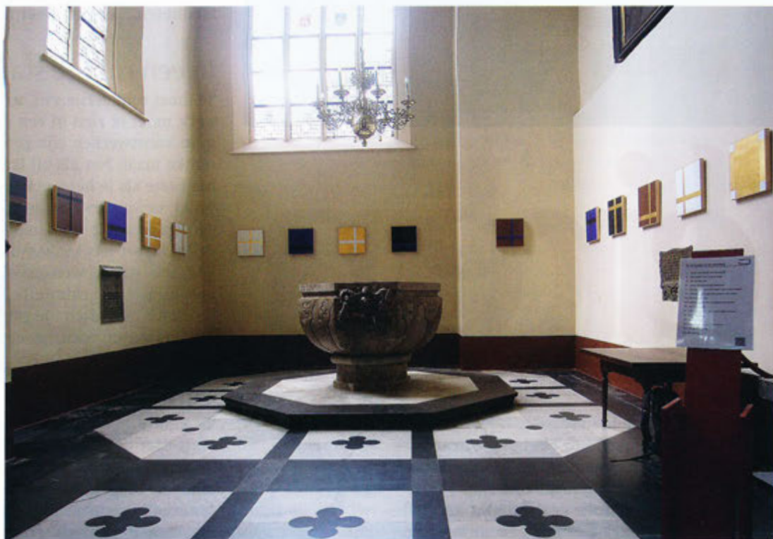
Kruisweg van de Verstilling , 2008- 2010, doopkapel St.-Salvators- kathedraal, Brugge.

Naast beeldende kunst is architectuur nog steeds mijn tweede passie.'