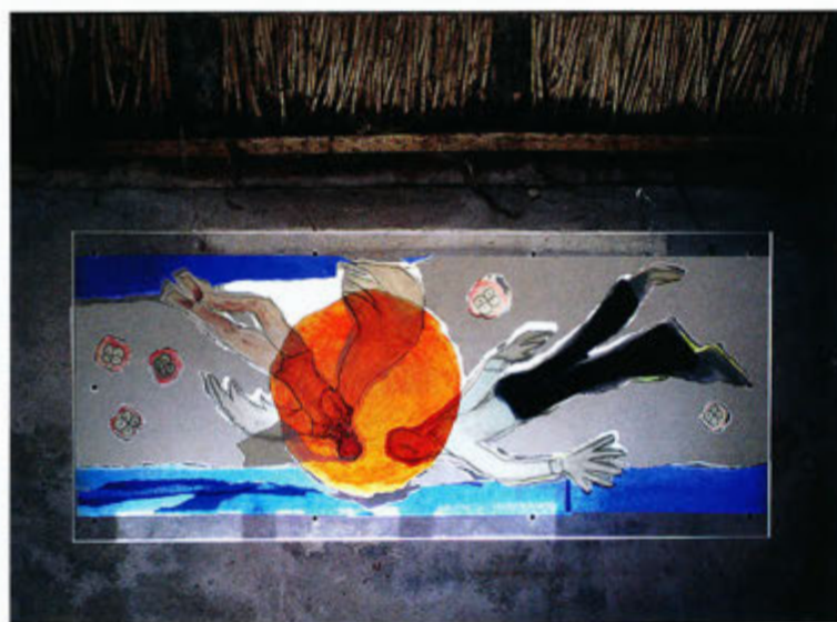
Psalm 139 (2003)