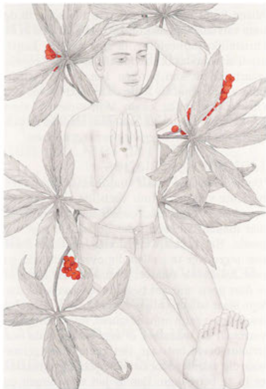
Wonderboom. 2012, 101 x 67 cm, potlood en waterverf op papier.

een tijdje en dan wil ik naar iets nieuws wat ik nog nooit heb gemaakt, maar de verschillen zijn marginaal natuurlijk. Het idee moet sterk zijn maar nog niet uitontwikkeld, gaandeweg kan ik dat achter de tekentafel ontwikkelen en me er door laten verrassen. Met die liggende mannetjes dacht ik: nu ga ik het over zwaarte hebben, over op de aarde liggen, diepe existentiële gevoelens. En dan heb ik ze een heel end en zet ik er bloemen omheen of vogels en wordt het toch een heel lieflijk werk. Zo krijgt het een dubbele inhoud, ik heb me in laten pakken door de sterke kracht om de tekening toch in harmonie te willen brengen.'